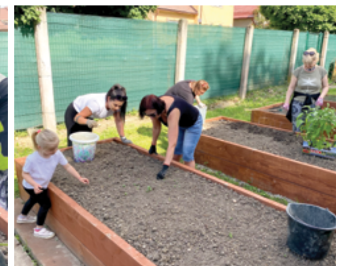
r. 2024 komunitná záhrada vytvára pozitívny vzťah k prírode aj u tej najmenej dobrovoľnícky