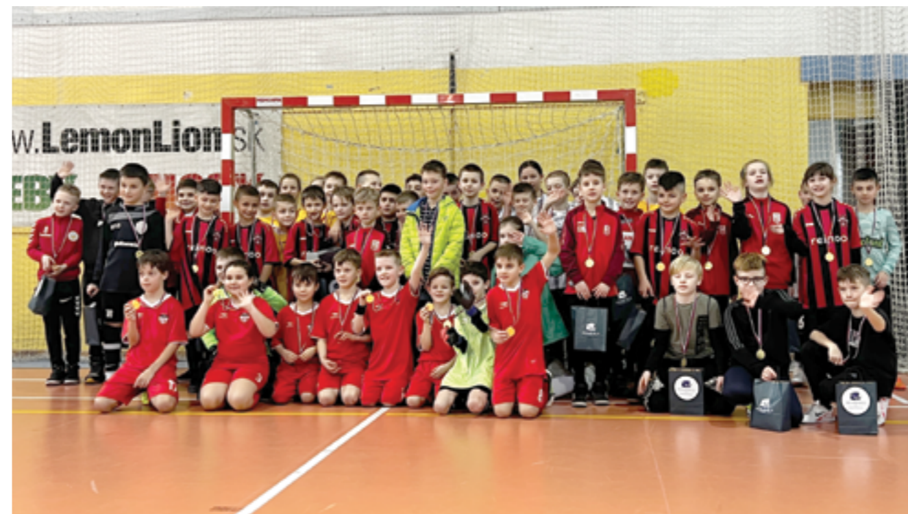
Radosť z ocenenia U10 na turnaji, ktorý sa konal v marci 2024

Futbal patrí medzi najpopulárnejšie športy na svete a jeho význam presahuje hranice fyzickej aktivity. Pomáha rozvíjať disciplínu, tímovú spoluprácu a vytrvalosť hráčov, čím prispieva k formovaniu ich osobnosti. Na Slovensku má mládežnícky futbal dlhú tradíciu a mnohé talenty vyrastajú v lokálnych kluboch, kde získavajú svoje prvé skúsenosti. Práve podpora mladých športovcov je kľúčová pre ich ďalší rozvoj a budúce úspechy. Členovia púchovskej organizácie Numenius vyhodnotili prvý rok pilotného programu na podporu športu. Cieľom grantového programu s názvom „Na jednej lodi“ je systematická podpora mládežníckeho futbalu, ktorý zohráva významnú úlohu pri výchove novej generácie talentovaných športovcov.