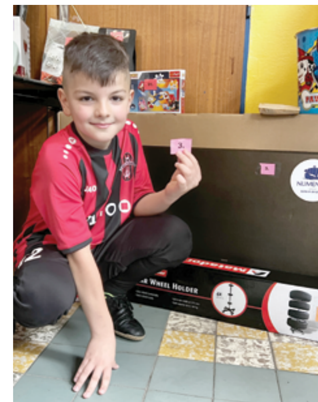
Šťastný výherca plazmovej televízie, ktorú darovala organizácia Numenius.

Členovia púchovskej organizácie Numenius vyhodnotili prvý rok pilotného programu na podporu športu. Cieľom grantového programu s názvom „Na jednej lodi“ je systematická podpora mládežníckeho futbalu, ktorý zohráva významnú úlohu pri výchove novej generácie talentovaných športovcov.