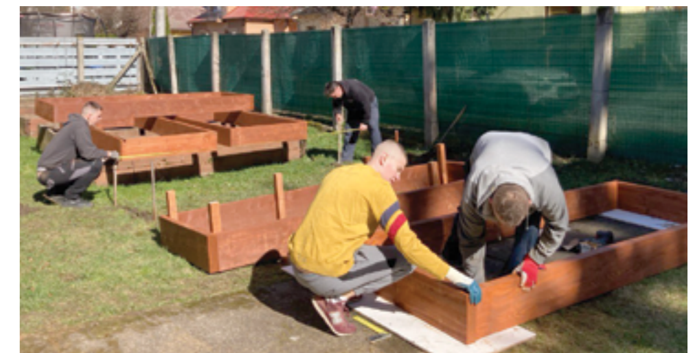
Pôvodné záhony sa postupne vymieňali za nové

Tento projekt ukazuje, že aj malé kroky môžu mať veľký dopad na komunitu a životy jednotlivcov. Komunitná záhrada nie je len miestom pre deti z detského domova, ale aj miestom, kde sa stretávajú ľudia, ktorí chcú zlepšiť svoje prostredie a podporiť druhých.