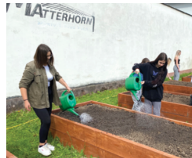
V roku 2024 sa do výsadby zapojili aj študenti zo SOŠOaS Púchov