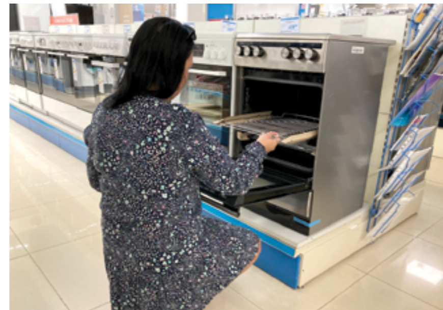
Klientka si vybrala sporák podľa vlastných predstáv