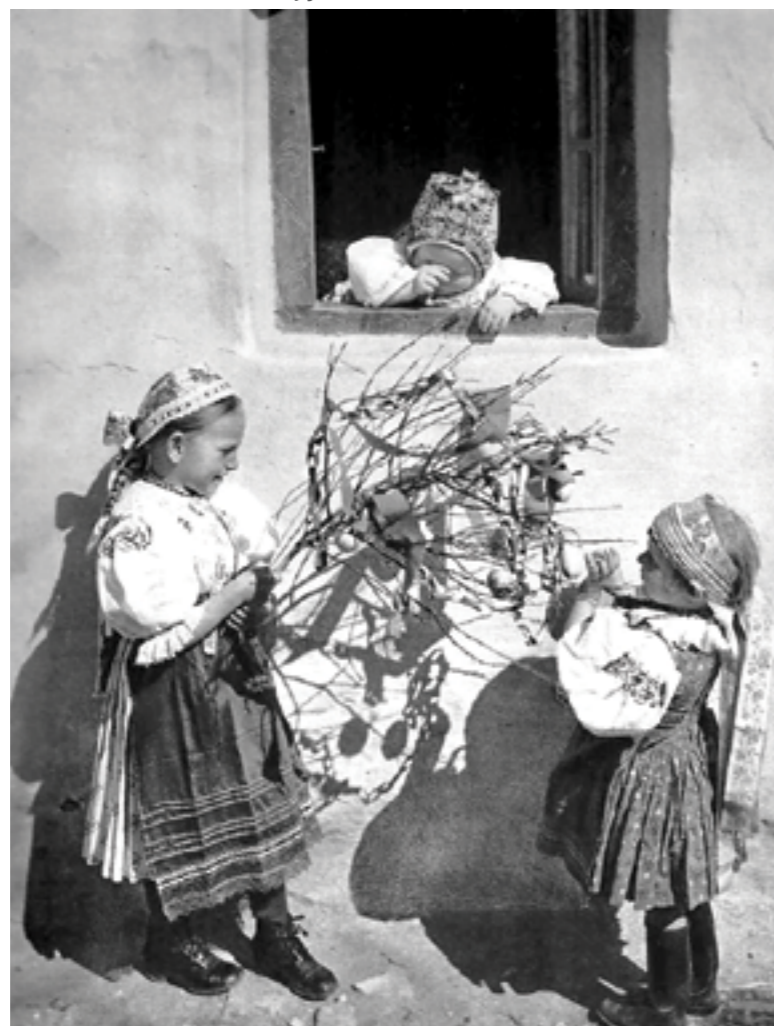
a lásky, a zdieľajme túto krásu s tými, ktorí sú nám najbližší.

Sila rašiacich prútov na korbáčoch sa mala preniesť na osoby, ktoré boli šibané. Očistným momentom je aj samotná bitka, znamená vyhnanie všetkého zlého. Mala prinášať svižnosť, čerstvosť, šikovnosť a plodnosť.