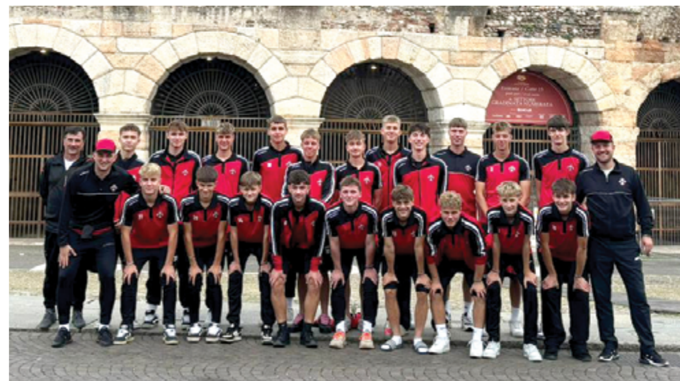
Púchovskí futbalisti kategórie U19 pred amfiteátrom vo Verone v októbri 2024