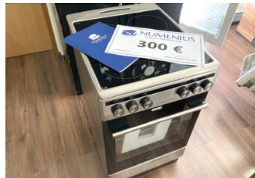
Dar od organizácie Numenius

Dôležitou súčasťou práce organizácií, ktoré sa venujú podpore jednotlivcov v náročných životných situáciách, je efektívna a citlivá komunikácia s klientmi. Pomoc je často postavená na princípoch spolupráce, kde odborníci pôsobia skôr ako sprievodcovia, inšpirujú k vlastnému rozvoju a podporujú osobnú iniciatívu pri hľadaní riešení. Kľúčovým prvkom tejto práce je schopnosť aktívne počúvať a prejavíť porozumenie bez predsudkov, čím sa vytvára bezpečný priestor pre klienta. Príkladom takejto situácie je aj prípad klientky, ktorá sa prostredníctvom sociálnych sietí obrátila na organizáciu Numenius so žiadosťou o pomoc.