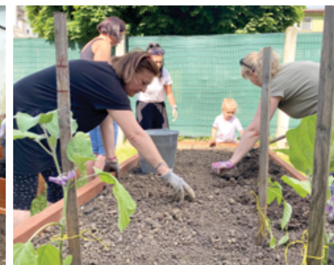
r. 2024 Komunitná záhrada spája generácie