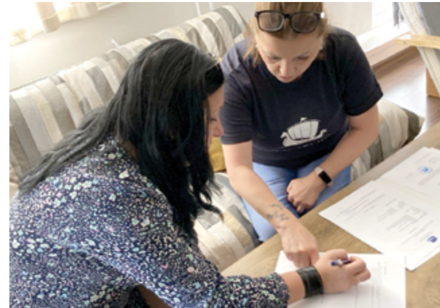
Pracovníci organizácie Numenius vypočuli klientku, navrhli riešenie a následne podpísali potrebné dokumenty

Numenius - sme tu preto, aby sme pomáhali, pretože každá situácia má svoje riešenie.