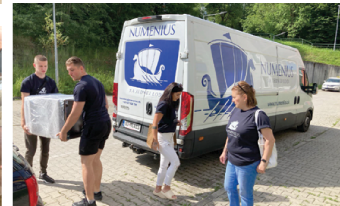
Dovoz a vynesenie priamo do bytu

Tento prípad ukazuje, že odborná pomoc má zmysel najmä vtedy, keď je postavená na dôvere, porozumení a spolupráci. Klientke sa vďaka podpore podarilo nájsť konkrétne riešenia a zároveň posilniť vlastnú iniciatívu, čo bolo kľúčové pre zvládnutie náročnej situácie.