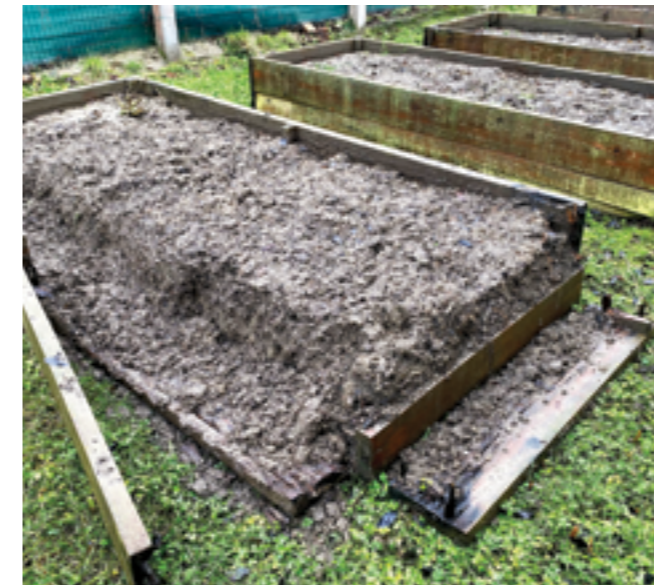
r. 2016 - 2024 Pôvodne vyvýšené záhony v detskom domove boli v žalostnom stave, no vďaka organizácii Numenius a dobrovoľníkom v nich opäť ožil život

V srdci Púchova, medzi panelákmi, vznikol projekt, ktorý spája komunitu, deti a dobrovoľníkov za účelom vytvorenia zeleného priestoru a podpory detí z Detského domova. Projekt Komunitná záhrada organizovaný neziskovou organizáciou Numenius a jej tímom, spolu s miestnymi obyvateľmi, študentmi a dobrovoľníkmi, sa zameriava na zlepšenie životného prostredia a rozvoj nových zručností u detí.