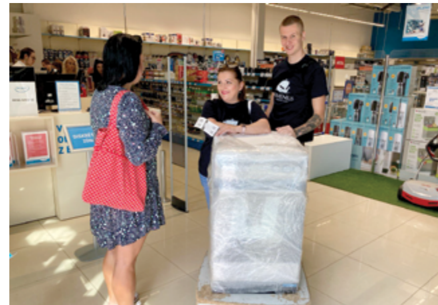
Pracovníci organizácie Numenius spolu s klientkou pri nákupe elektrického sporáka