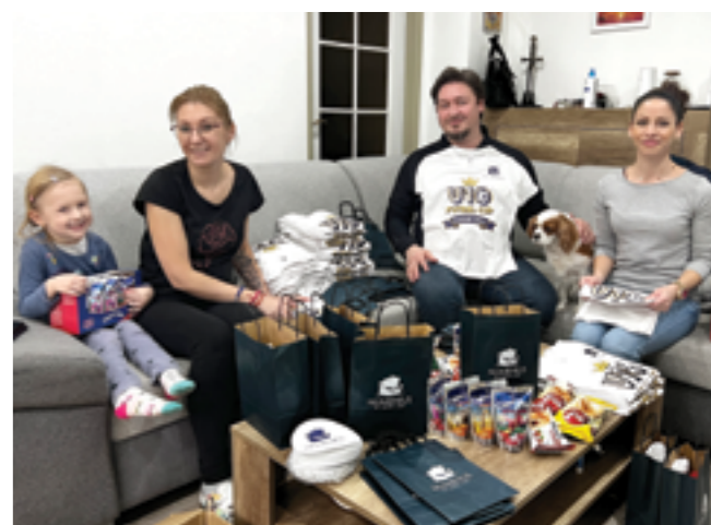
Organizácia Numenius spolupracuje s rodičmi a dobrovoľníkmi pri balení darov pre púchovskú U10