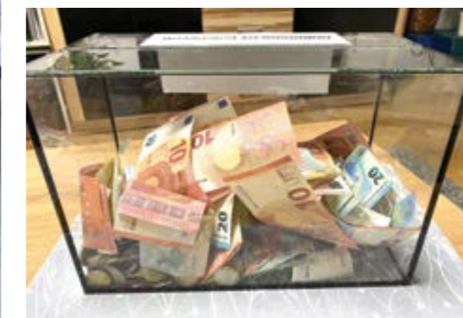
Dobrovoľná zbierka na jarmoku 2024

Všetky naše aktivity financujeme z vlastných zdrojov. Pred mesiacom sme založili aj vlastný Transparentný účet Numenius ,