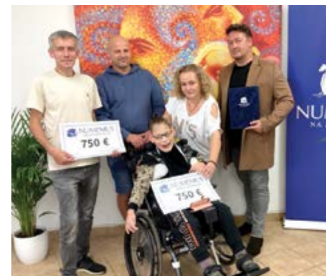
Odvádzanie zbierky 2024