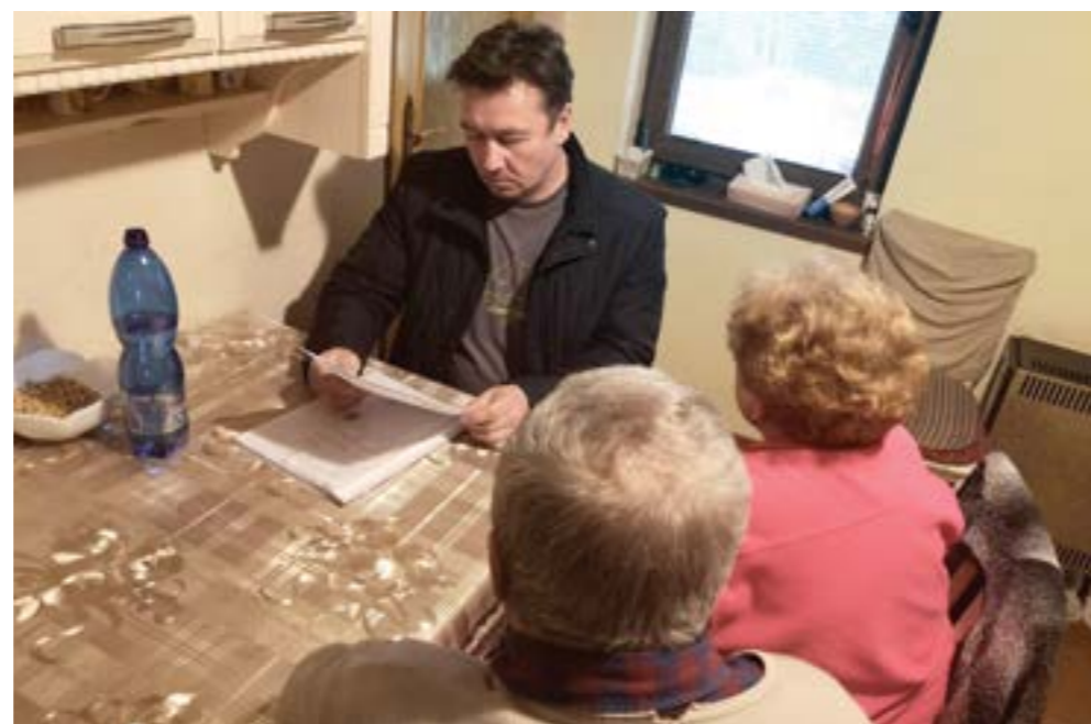
Poradenstvo u klientov

Na našu organizáciu sa obrátila staršia pani, ktorá sa ocitla v zložitej situácii. Svojím príbuzným požičala úspory s dohodou, že jej ich budú postupne splácať. Po čase však splátky prestali prichádzať a pani zostala bez peňazí aj bez reakcií na SMS správy a ani telefonáty jej neter nezdvihala.